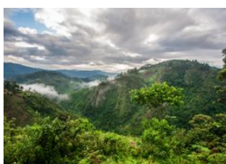
Queen Elisabeth (Ishasha) 📍 🚗 130km - ⌚ 4h 15m Parc national de Bwindi 📍