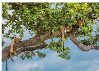
Parc national Queen Elizabeth 📍 150km - ⌚ 2h Queen Elisabeth (Ishasha) 📍