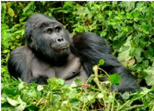
Parc national de Bwindi 📍 🚗 50km - ⌚ 1h Parc national de Bwindi 📍