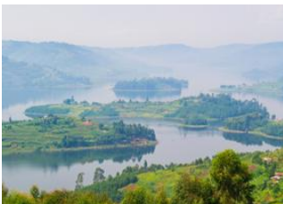
Parc national de Bwindi 📍 🚗 35km - ⌚ 1h Lac Bunyonyi 📍