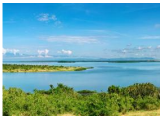
Parc national de Kibale 📍 🚗 100km - ⌚ 2h 30m Parc national Queen Elizabeth 📍