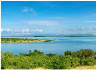
Parc national de Kibale