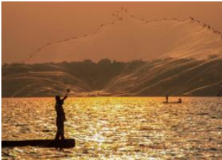
Marais de Mabamba 📍 🚗 40km - ⌚ 1h 30m Départ 📍