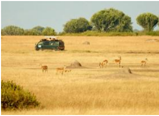
Parc national Queen Elizabeth