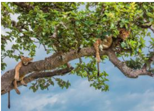
Parc national Queen Elizabeth