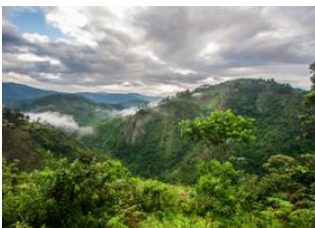
Queen Elisabeth (Ishasha)