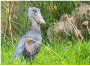
Marais de Mabamba 📍